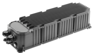
Unità di alimentazione remota per Smart [PRO] 3x2M