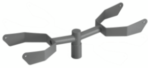
Staffa testa palo doppia per Mercurio 1.