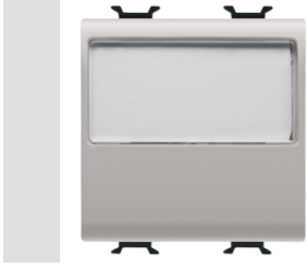
Red Dot anotlanmış alüminyum işaretçi desteği siyah