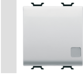
Red Dot anotlanmış alüminyum işaretçi desteği siyah