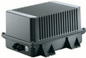
Gruppo di alimentazione.