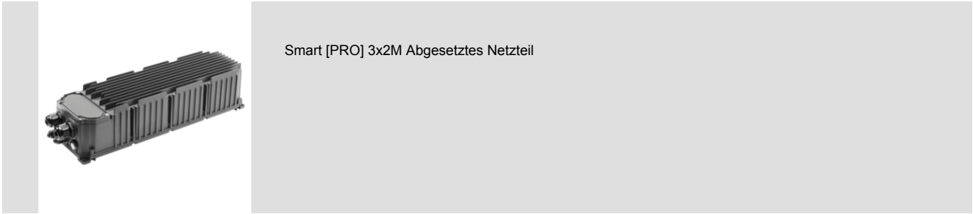
Smart [PRO] 3x2M Abgesetztes Netzteil