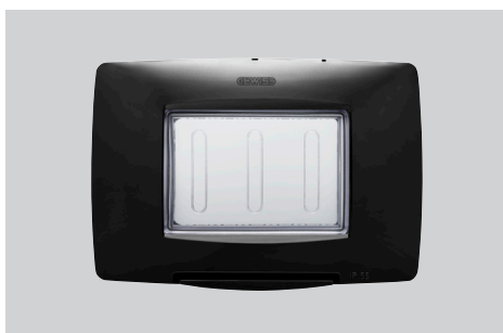
Colori: bianco, nero e titanio Modularità: 3 posti Adatta per: scatola rettangolare