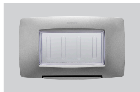
Colori: bianco, nero e titanio Modularità: 4 posti Adatta per: scatola rettangolare