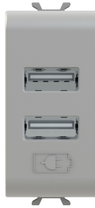
GW 11 450