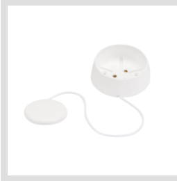
Accessorio per montaggio a parete del sensore acqua connesso GWA1514.